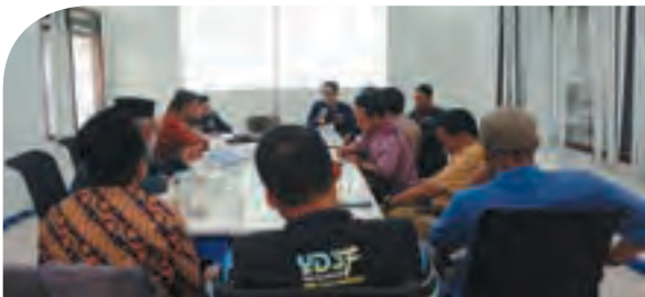
Rapat Koordinasi (Rakor) Dai Desa YDSF kembali digelar awal tahun 2024.

Sekitar 10 dai desa turut hadir dalam kegiatan yang di gelar di Graha Zakat 2 YDSF Jl. Kertajaya 8C No. 11, Surabaya itu. Rakor kali ini membahas tentang program tahunan Dai YDSF, setelah pada penghujung tahun 2023 diadakan perubahan kepengurusan. Salah satu usulan terbaru adalah dengan menggelar program Grebek Masjid (Gerakan Bersama Memakmurkan Masjid) yang di dalamnya terdapat program GSB (Gerakan Subuh Berjamaah) dan GMB (Gerakan Masjid Bersih) agar dapat menjangkau pelosok-pelosok desa.