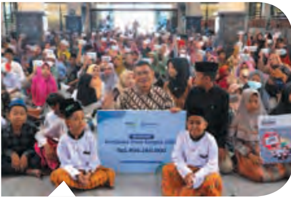
YDSF merealisasikan Beasiswa Pena Bangsa senilai Rp1,4 miliar untuk 2.284 siswa tak mampu dari seluruh Indonesia di tahun ajaran 2023/2024.