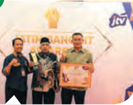
Menyongsong Milad ke-37 tahun kebersamaan umat, beragam penghargaan diraih YDSF. Selama tahun 2023, YDSF meraih penghargaan dalam ajang Top Brand Award , Jatim Bangkit Award , dan Indonesia Fundraising Award .