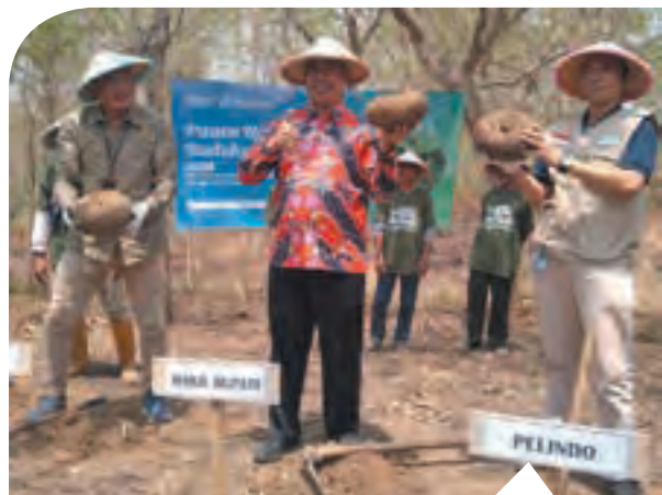
Program pemberdayaan YDSF bekerjasama dengan PT Pelindo melakukan panen raya Porang di Saradan, Madiun. Dalam program itu, 50 ton Porang dipanen setelah dikembangkan selama kurang lebih 2 tahun.