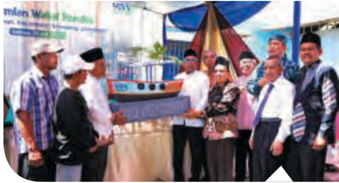
Perahu Wakaf YDSF resmi melaut sebagai solusi nelayan lepas dari jeratan hutang dan riba. Jajaran Pengurus dan Pembina YDSF serta Badan Wakaf Indonesia Jatim secara simbolis meresmikan perahu wakaf bersama nelayan Brondong, Lamongan.