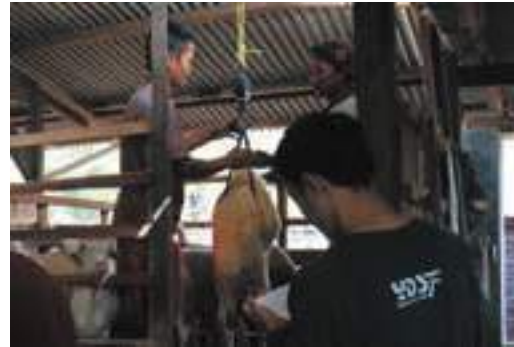
Pastikan sehat dan sesuai syar'i, Tim Ekspedisi Qurban timbang hewan qurban