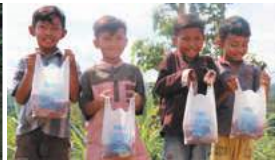
Cegah stunting , YDSF Penuhi kebutuhan gizi anak hingga pelosok