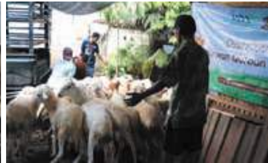
Proses muat domba masuk ke dalam kendaraan