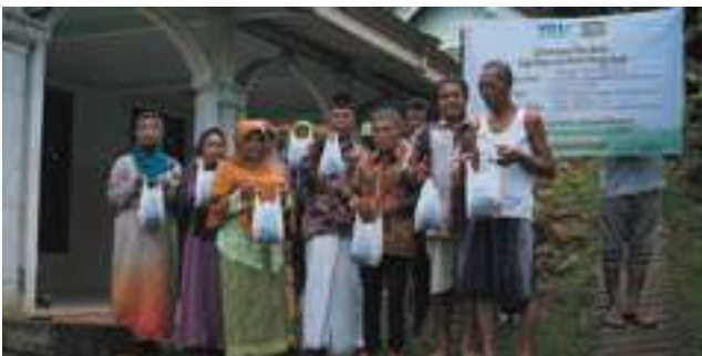
Semarak warga Sukorejo, Trenggalek, Jatim setelah lama tak nikmati daging qurban