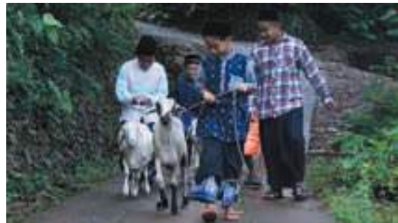
Bahagia anak desa terima domba qurban YDSF sesaat sebelum disembelih