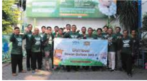
Pemberangkatan tim Ekspedisi Qurban YDSF 2023 untuk mengawal pendistribusian hewan qurban.

Pelaksanaan Ekspedisi Qurban 1444 H telah usai. YDSF bersama Sahabat Mudhahi turut membahagiakan masyarakat di berbagai pelosok negeri. Tercatat, 1.100 ekor domba dan 125 ekor sapi terdistribusi di 50 kota/kabupaten di Indonesia dan Uganda. Alhamdulillah , pemenuhan gizi protein hewani telah dirasakan manfaatnya.