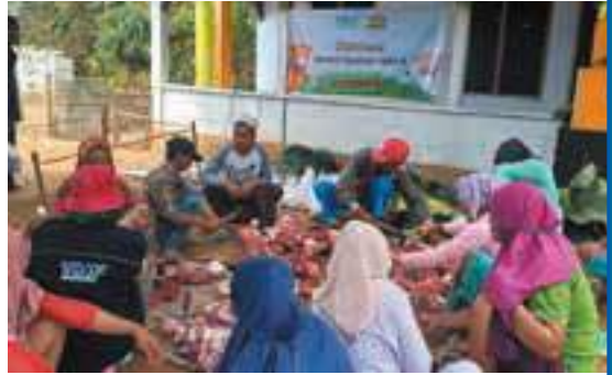
Gotong royong warga kelola daging qurban di Dusun Mindi, Situbondo, Jatim