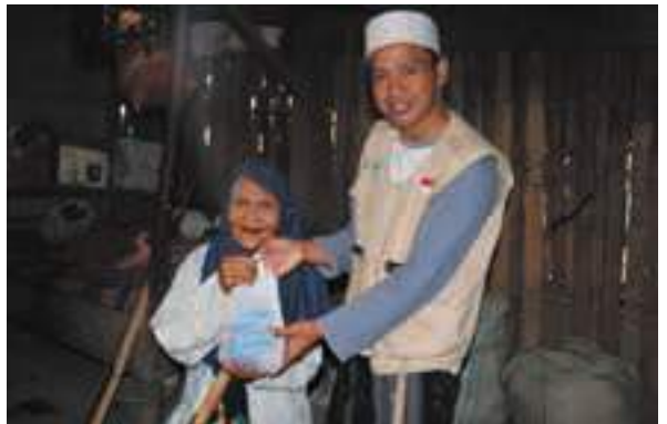
Lansia dhuafa turut terima daging qurban