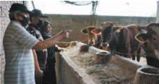
Tinjau langsung ke kandang, mudhahi borong 6 ekor sapi