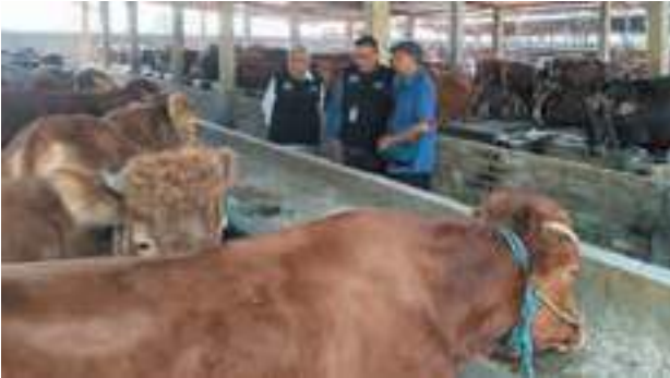
Pengurus YDSF survei kandang sapi, pastikan sesuai syar'i