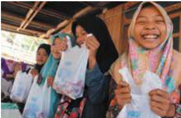
Senyum sumringah anak-anak, wujud bahagia terima daging qurban YDSF