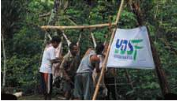
Antusias warga sembelih qurban di pegunungan Sukorejo, Trenggalek, Jatim