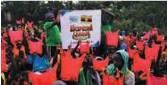
Bahagia warga Uganda terima daging qurban YDSF