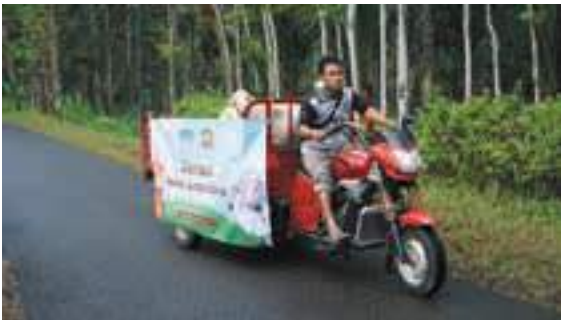
Lewati berbagai medan, distribusi qurban jangkau hingga pegunungan